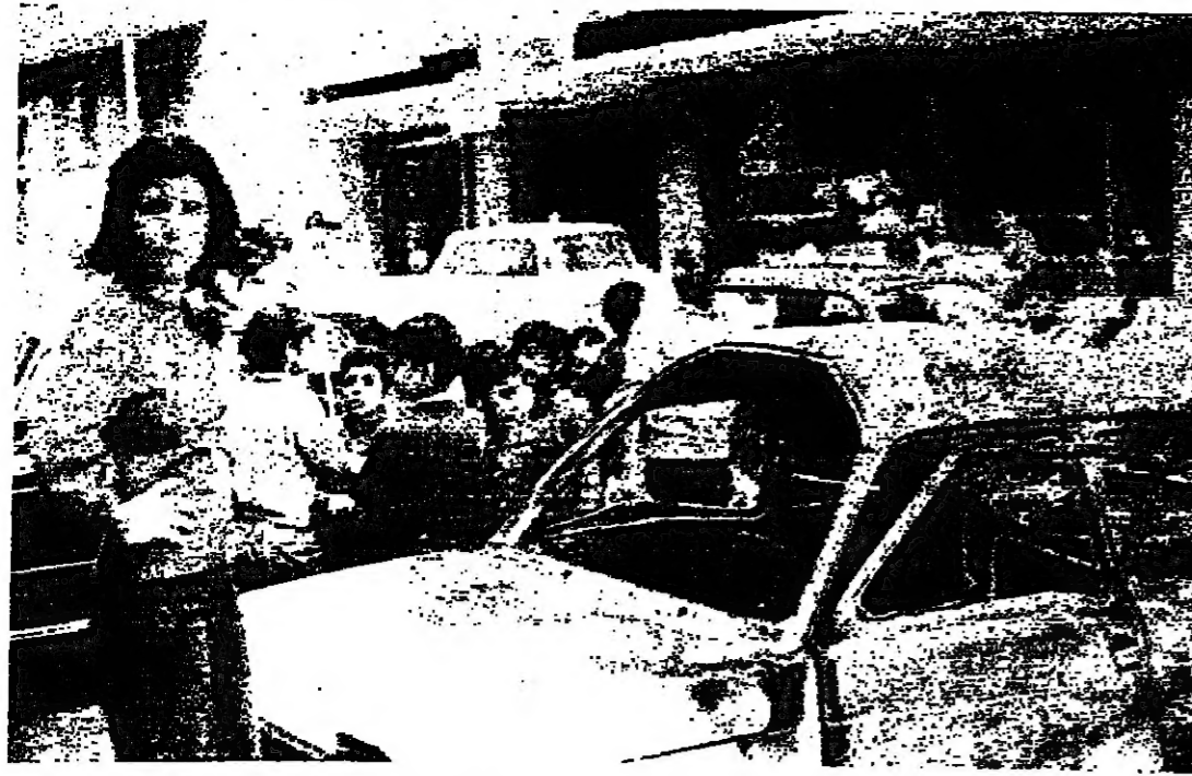
صاحبة السيارة المتوفى الاستاذ الحاج، أمام سيارتها بعد الانفجار

وتولى رجال الإطفاء إخماد الحريق الذي اندلع بالسيارة، والسيارة من نوع فيات (117) طراز 1974 ونقص التماس وتصدت بموتها الحاج (24 سنة) وكنت بنتها في عين الرمانة.